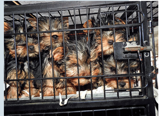
Gestapelt wie Konserven: Nicht alle Welpen überleben den Transport nach Deutschland