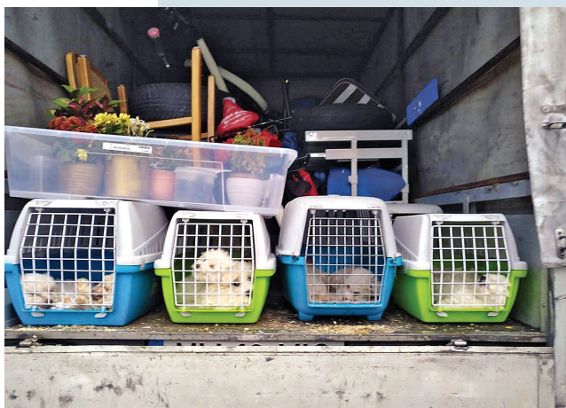
Die Malteserwelpen wurden aus Rumänien illegal nach Deutschland gebracht. Sie waren noch keine acht Wochen alt