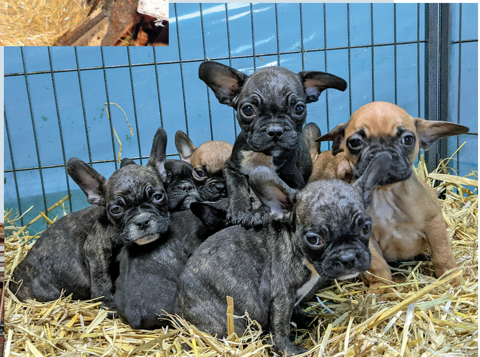
Gemeinsam mit der Polizei und dem Veterinäramt beschlagnahmte Vier Pfoten diese Welpen in Köln