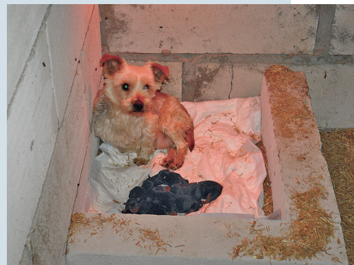
Kein Futter, kein Wasser, keine Wärme: Das Foto wurde von Tierschützern in Polen aufgenommen