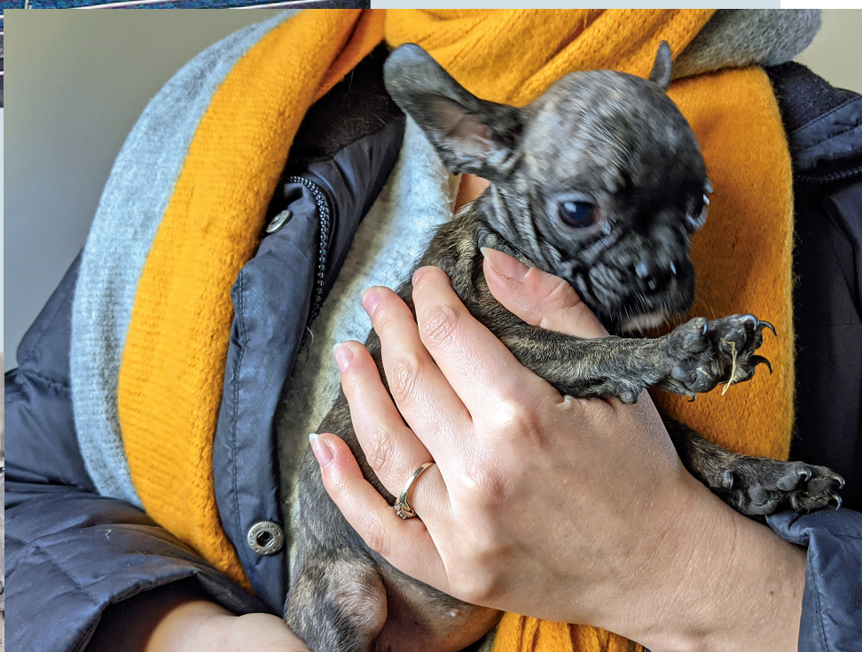
Diese kleine Französische Bulldogge überlebte nur knapp