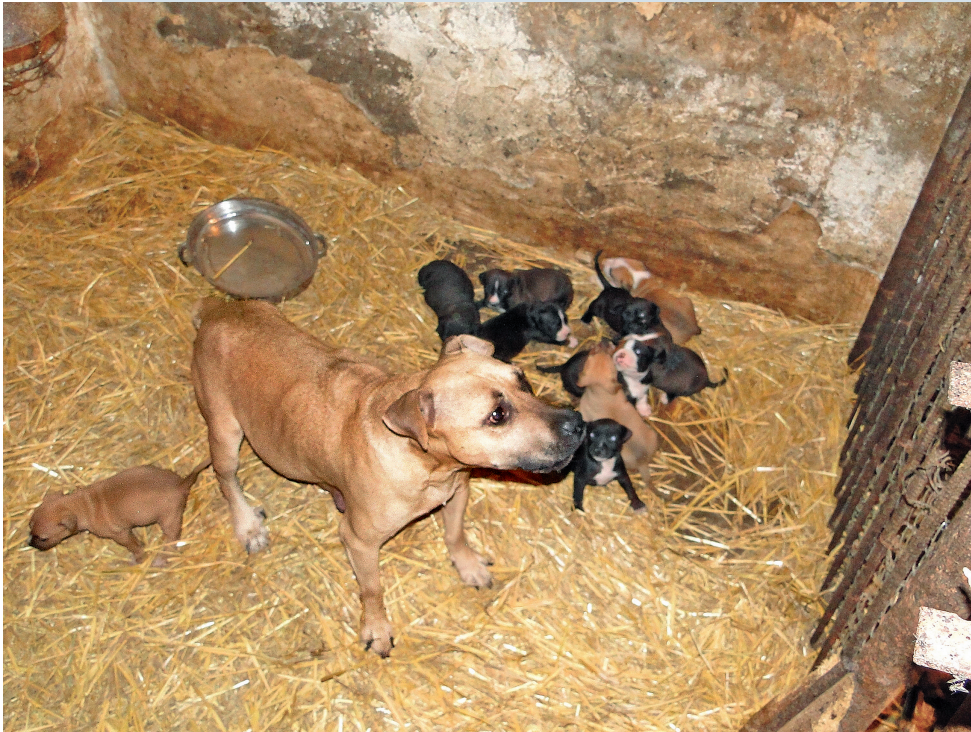
Diese Hündin in einer polnischen Vermehrerstation kann ihren winzigen Zwinger nie verlassen